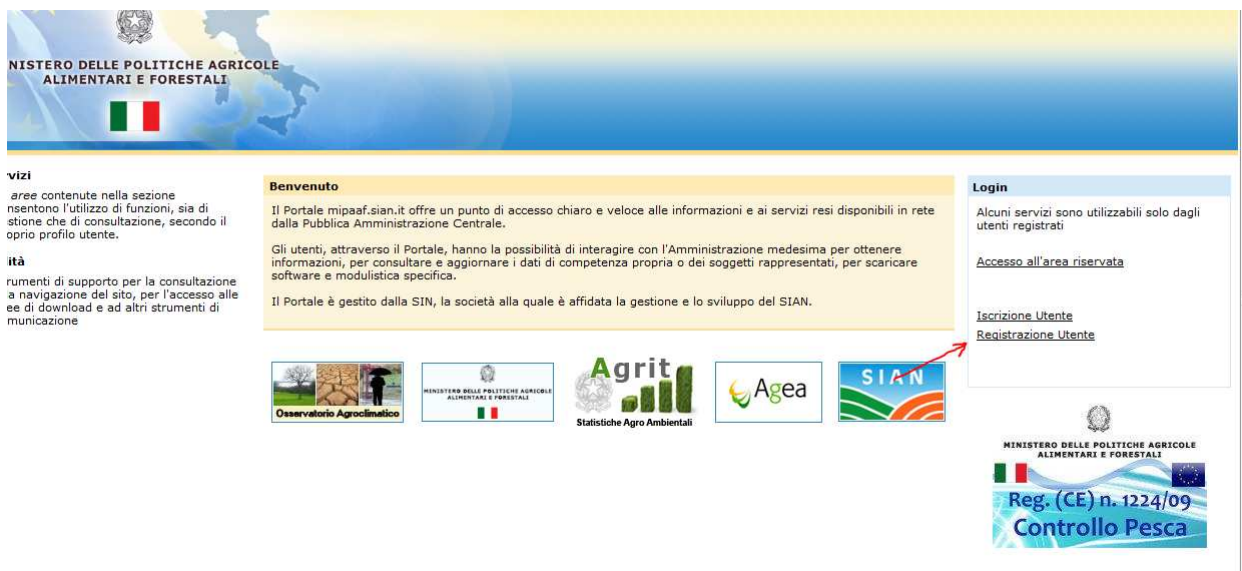
Fig. 2 – Registrazione – Link alla registrazione