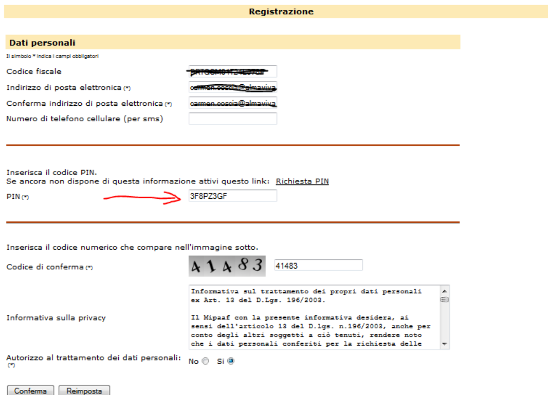
Fig. 6 – Registrazione – Inserimento del PIN

Se il richiedente è in possesso del PIN, lo inserisce e prosegue come indicato nella Fig.6. Verrà inviata dal sistema una e-mail con un link che dovrà essere necessariamente premuto per attivare l'utenza e la password di primo accesso. Tale password dovrà essere modificata al primo login con una personale e nota solo all'utente.