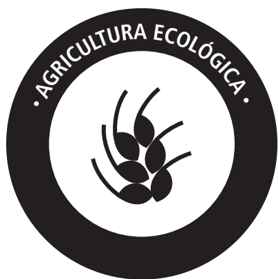
PANTONE REFLEX BLUE