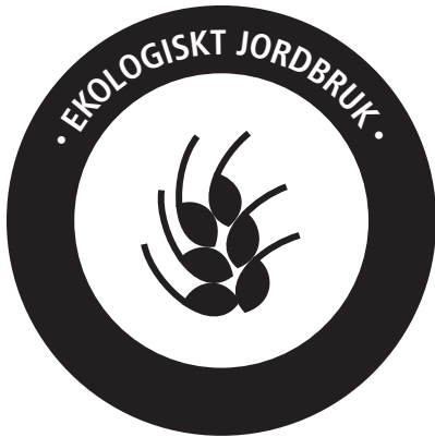
PANTONE REFLEX BLUE